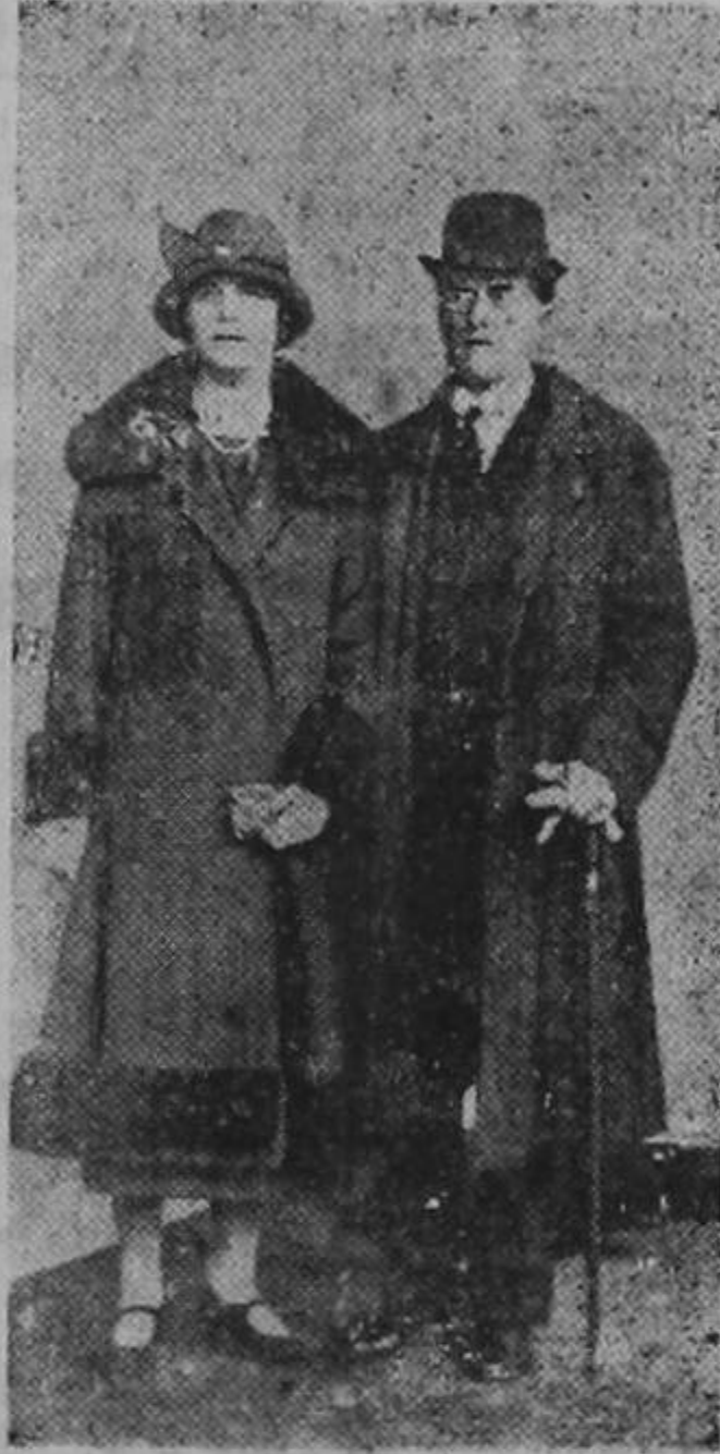
El Ministro de RR. EE. de Inglaterra Mr. Chamberlain que antier se hallaba en Panamá en compañía de su señora esposa, en viaje de salud.

de cada sección de Hombres y Mujeres, está formada por elementos sociales de prestigio en la Parroquia, y de vida ejemplar y virtuosa.