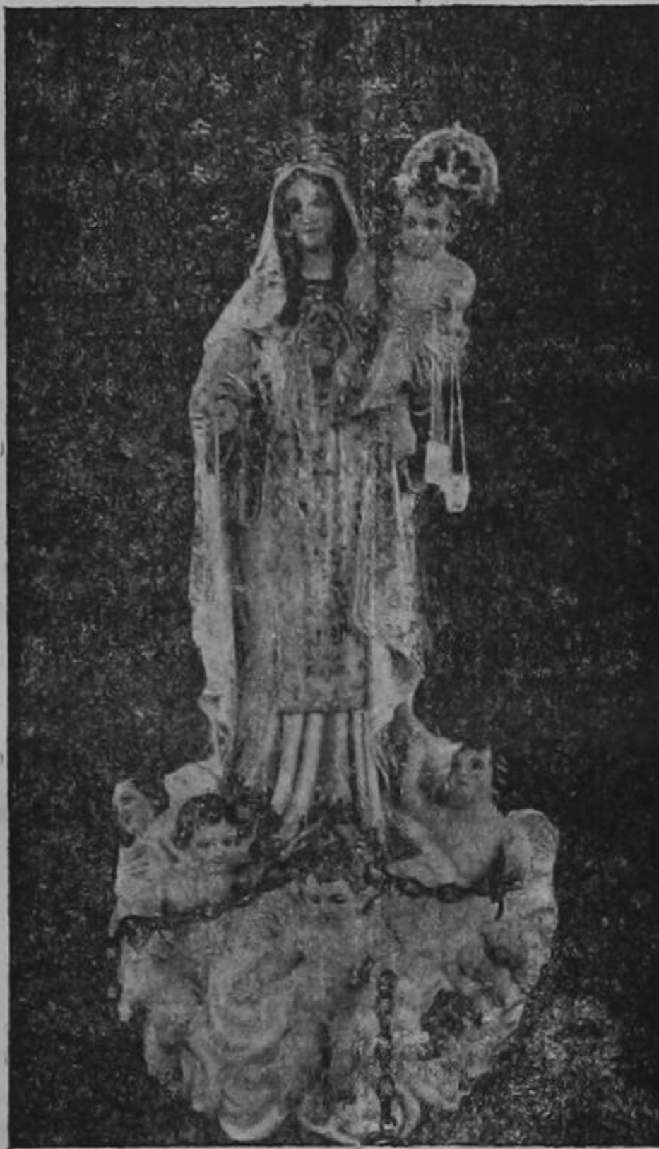
Imagen de la Virgen de las Mercedes, venerada en el Templo de su nombre

El telegrama dice Depositado en San José el 17 de enero de 1893.