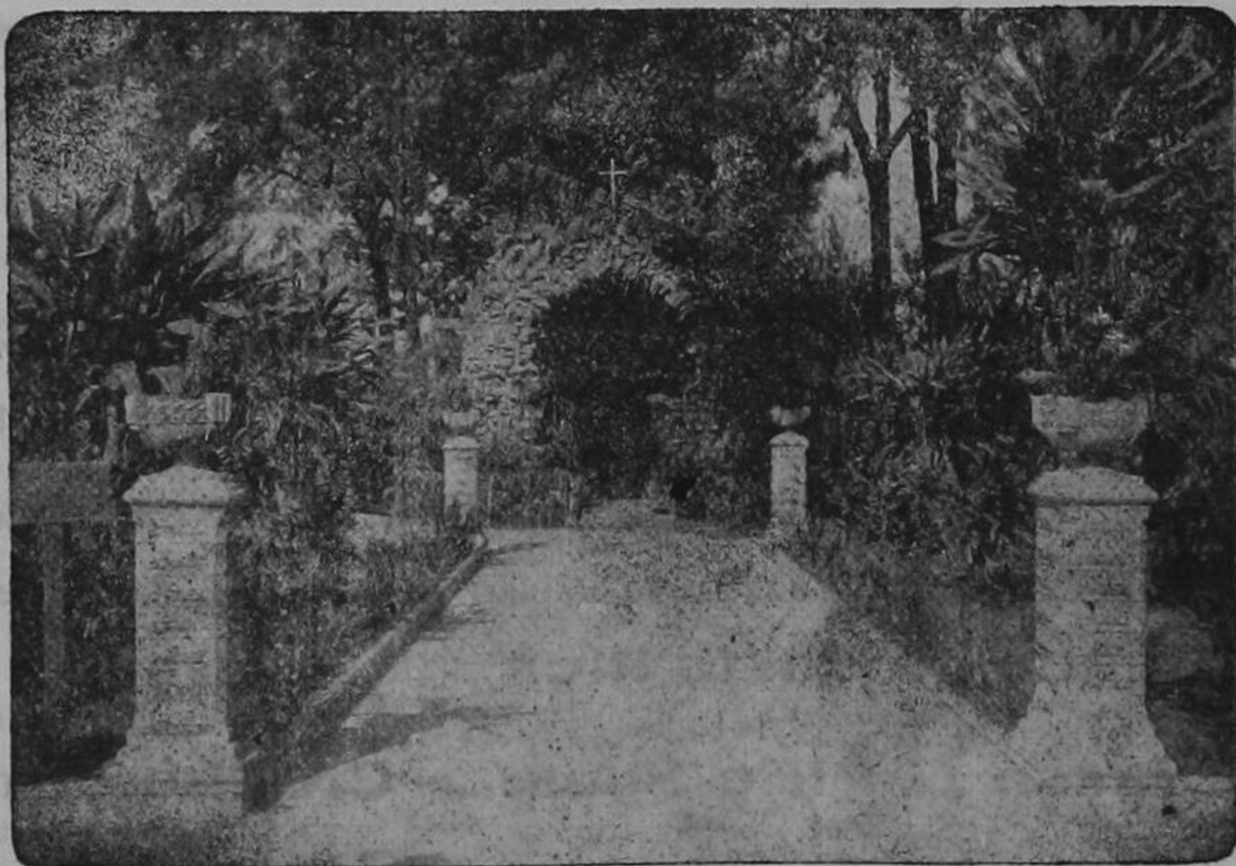
Gruta de Lourdes de La Merced