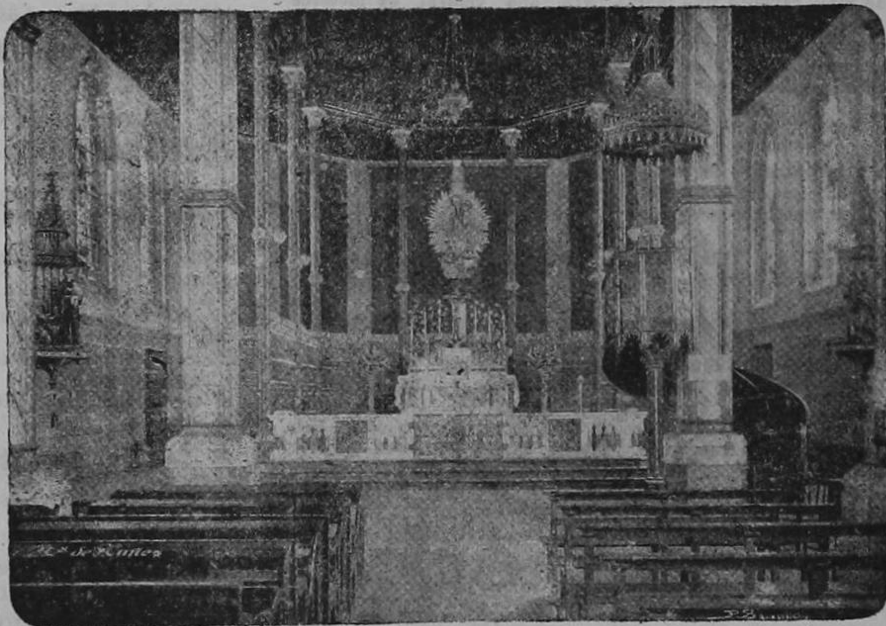
Interior del templo